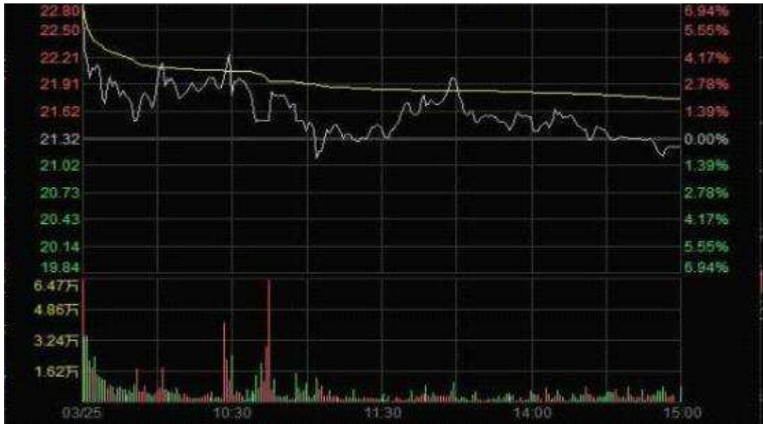
图 2 3 月 25 日“X”股价分时走势

活跃在涨停板上的操纵者和正常投资者的交易行为有明显的区别，他们在成功拉升股价后随即反向卖出，或者大量撤单以避免真实成交，反映出他们的意图在诱骗其他投资者跟风买入，而没有真实投资目的。这种行为违反了《证券法》第七十七条禁止单独或者通过合谋，集中资金优势、持股优势连续买卖，或者以其他手段操纵证券交易价格或者证券交易量的规定，构成《证券法》第二百零三条操纵市场的情形，当然难以逃脱证监会的法眼，2014 年和 2015 年唐某某因操纵市场先后被证监会两次行政处罚，为规避监管，唐某某转战香港，通过沪港通继续操纵 A 股股票，“魔高一尺、道高一丈”，2017 年证监会再次将唐某某等人绳之以法，前后共开出 12 亿元罚单。